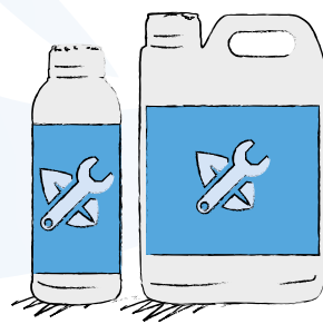
Confezioni da 1l e 5l

Prodotto formulato con Fosforo ad elevata concentrazione; rapida assimilazione a livello fogliare e radicale; migliora notevolmente la struttura e la consistenza dei tessuti vegetali. Ideale per applicazioni fogliari ed in fertirrigazione, il prodotto risulta sicuro nel suo impiego. La presenza di veicolanti naturali all'interno del prodotto, permette un'ottimale assimilazione a livello cellulare, garantendo lo svolgimento di funzioni metaboliche indispensabili per lo sviluppo della pianta (sintesi energetica, strutture cellulari, produzione di metaboliti di difesa). Elevata purezza di composizione; il prodotto non lascia alcun tipo di residuo sulle colture.